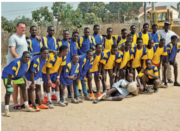
Die Kicker vom Portmore FC in Tanji