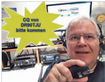
Harry – immer auf Empfang

Die Gemeinsame Aktivität Deutschland/Schweiz aus Anlass des 90. Jahrestages des Erstfluges der JU 52/3m – liebevoll auch „Tante JU“ genannt Nach der Entstehung der „Deutschen Luft Hansa AG“ im Jahre 1926 blieben staatliche Subvention an die Luftverkehrsgesellschaft notwendig, denn zu keiner Zeit flog die „Luft Hansa“ wirtschaftlich. Hugo Junkers wollte aber diesen Zustand verändern und beauftragte seinen Chefkonstrukteur Dipl.-Ing. Ernst Zindel, ein Passagier- und Frachtflugzeug zu entwickeln. Im Jahr 1930 entstand die JU52/1 mit einem Mittelmotor und einer Reichweite von ca. 1500 km. Die Maschine konnte eine wesentlich höhere Nutzlast transportieren. Im Jahr 1931 wurden in den Werken des Luftfahrtpioniers Hugo Junkers, basierend auf der JU52/1, durch Ernst Zindel die JU52/3m entwickelt und die Flugerprobung fand statt. Am 07. 03. 1932 fand der offizielle Erstflug statt.