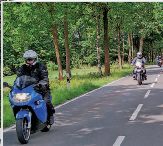
Motorrad – In der Lüneburger Heide