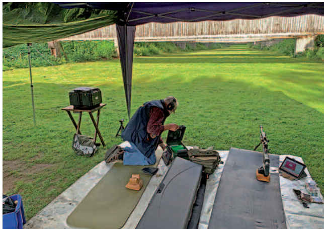
Beim Training auf der Schießanlage