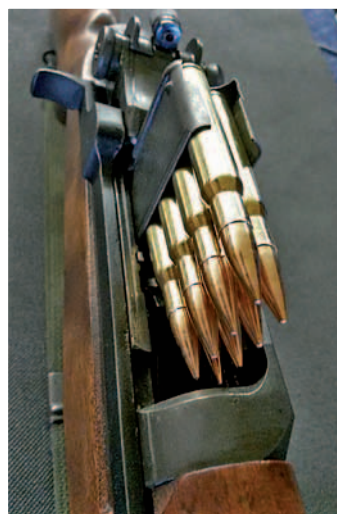
Dienstgewehr M 1 Garand (oben)