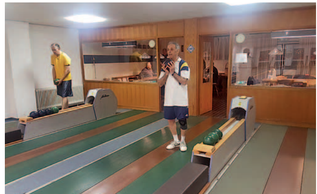
Training für das Heimspiel