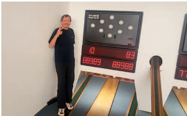
Klappt doch – 83 Holz, 10 Wurf

Aktuell: Die Punktspielsaison 2021/2022 hat im September mit 6 Mannschaften in der Sonderklasse