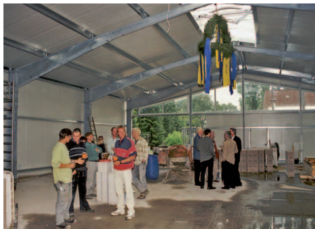
18. Juli 2002: Handwerker und Mitglieder des LSV beim Richtfest