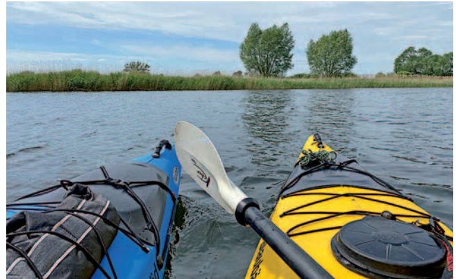
Käpt'n Blaubär und Hein Blöd Seite an Seite