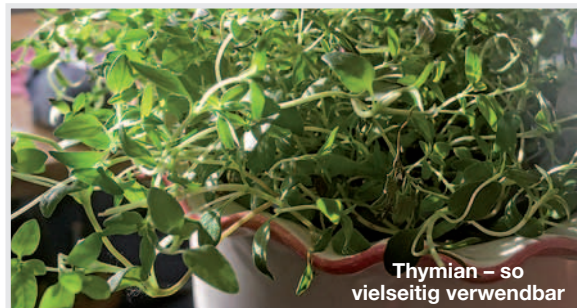
Thymian – so vielseitig verwendbar