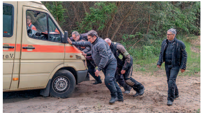
Heidekutsche (oben), Visierwäsche (mittig), Hilfeinsatz (unten)