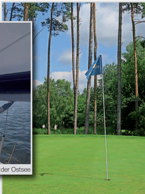
Golf – In Bad Bevensen