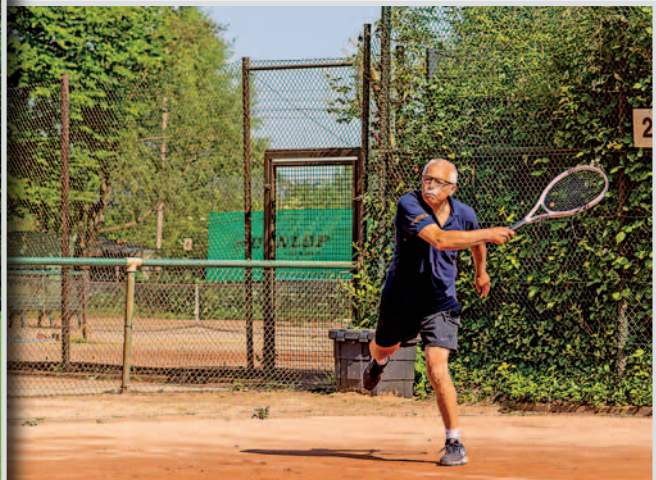
Tennis – Auf der LSV-Tennisanlage