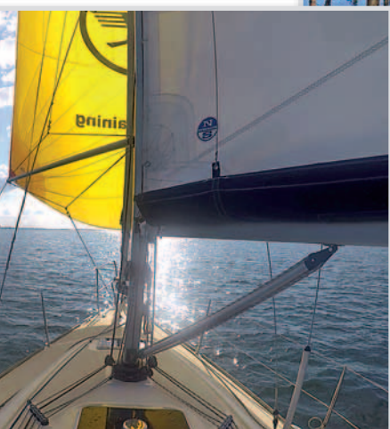
Segeln – Auf der Ostsee