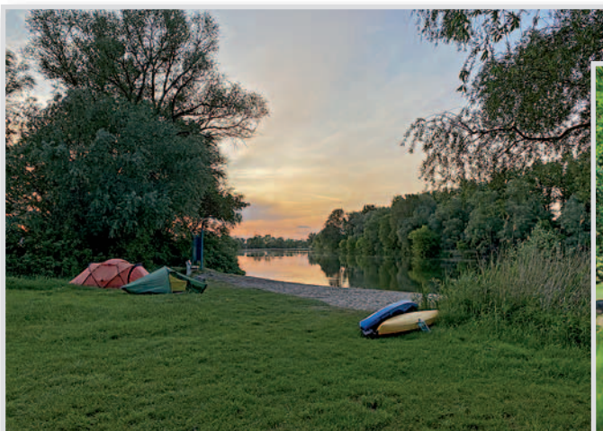
Kanu – An der Havel