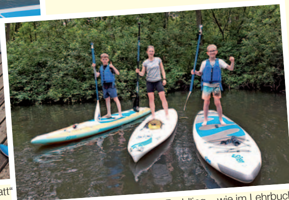
Standup Paddling – wie im Lehrbuch